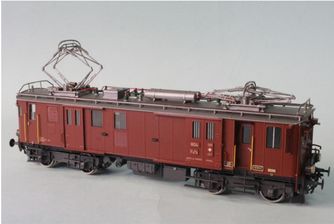
vue de la machine Fe 4/4 no 804 "Seetaler"

Les réservations sont déjà en route; vous trouvez ci-joint la feuille de réservation avec les détails (un acompte à la réservation n'est pas nécessaires chez FULGUREX). Nous vous informons à temps via les FULGUREX-News conc. la production, les fotos des prototypes, l'état des réservations, livraison, etc. Veuillez consulter aussi notre site: www.fulgurex.ch pour les infos de notre production des modèles en laiton.