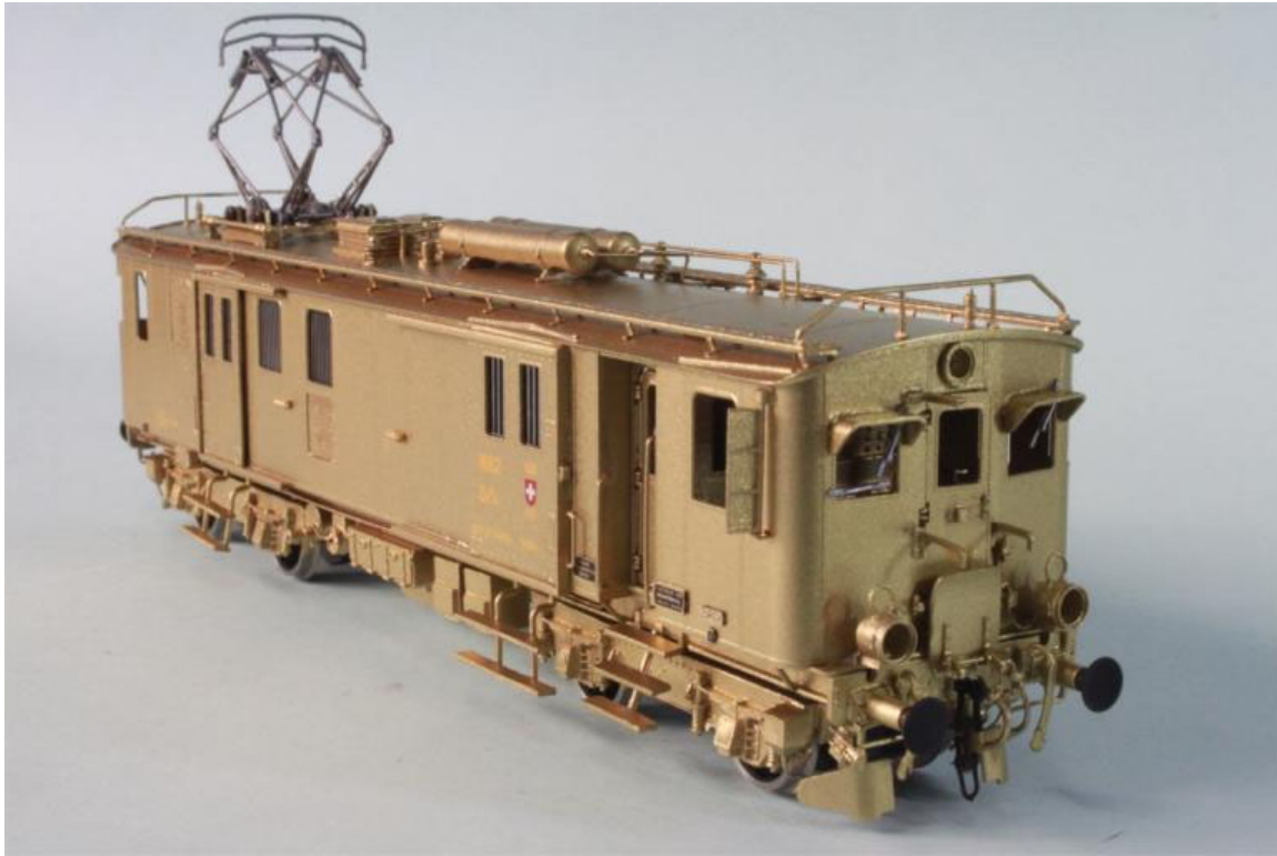
Prototyp de la SBB/CFF De 4/4 no 1662 "Seetaler", brun/rouge, transformation, aussi avec fenêtre à gauche (visible sur la foto del no 804), system freinage électrique, 1 panto, env. 1965, (notre Art.no.: 2268/5)

Sur la ligne Le Brassus-Puidoux-Vevey dans la Vallée de Joux circulent à partir octobre 1938 aussi des Fe 4/4. Ces machines sont équipées avec des grands chasse-neiges (comme i.e notre Art.no.: 2268/6 Fe 4/4 no 831).