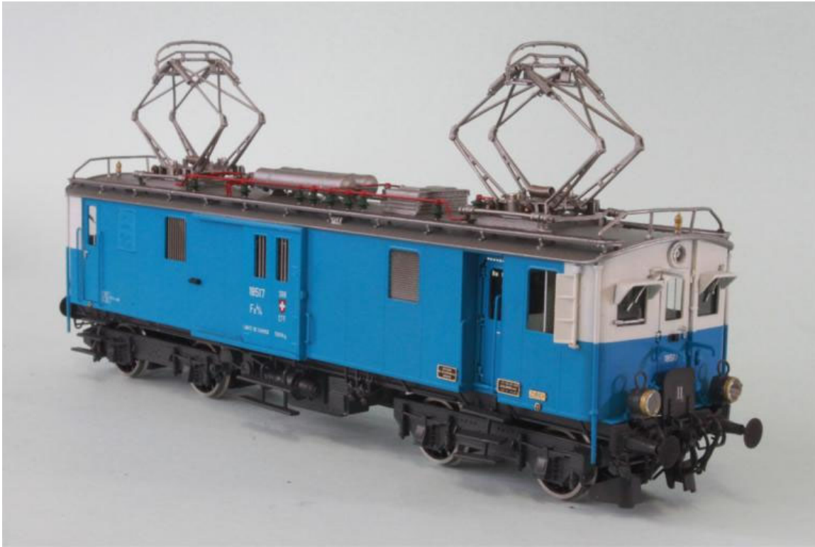
SBB/CFF Fe 4/4 "Zürcher-Lackierung", paradoxerweise handelt es sich hier um die Maschine die im Raum Basel um 1929 als "Arbeiter-Pulman" eingesetzt wurde, orig. Betriebsanstrich und Beschriftung (nicht zu verwechseln mit der Verkehrhaus-Museumsversion), diese Maschine hat natürlich noch Stangenpuffer übrigens; der Tachycounter Antrieb fehlt noch. Unsere Art.no.: 2268/3