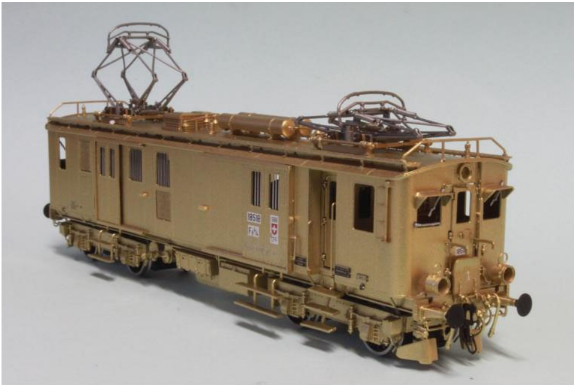
Der Gegensatz zu der obigen Maschine; hier das noch unbemalte Modell der blau/weissen Version, die 1930 im Raum Zürich als "Arbeiter-Pulmann" verkehrte, hier allerdings als Museumsversion. 1932 wurde, mangels Erfolg, die blau/weiße Farbe wieder auf das SBB grün umlackiert. Der Triebwagen verbrachte seinen Lebenslauf, mit allen Anpassungen als grünen Triebwagen. Als Museums-Maschine wurde der Wagen dann wieder auf blau/weiss umlackiert weshalb auch die linken Führerstandstüren zugeschweisst sind. Der Triebwagen erhielt eine Beschriftung auf weissem Grund. Die Modell wird noch die Hülsenpuffer erhalten (dies ist an diesem Prototypen noch falsch). Unsere Art.no.: 2268/3a

Hier ein geschichtlicher Auszug dieser Triebwagen: