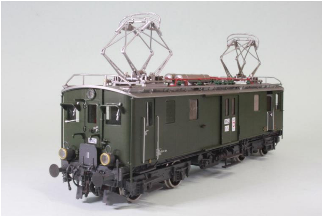
Fe 4/4 no 18512, Ur-Prototyp, altes SBB-grün mit Emailtafel Beschriftung, Sämtliche Türen zu öffnen, magnetisch gehalten (aussen- und innen öffnend plus Schiebetüren), echter Holzboden im Frachtraum und eine Unmenge an Details, Jahrgang ca. 1928, (unsere Art.no.: 2268)

Es handelt sich dabei um die originalen Triebwagen sowie auch deren Umnummerierungen; Maschinen mit 2 Pantografen, Umbau auf einem Panto, grüne oder braune Versionen (Seetaler), Beschriftungen mit Emailtafeln oder bemalt, je nach Epoche.