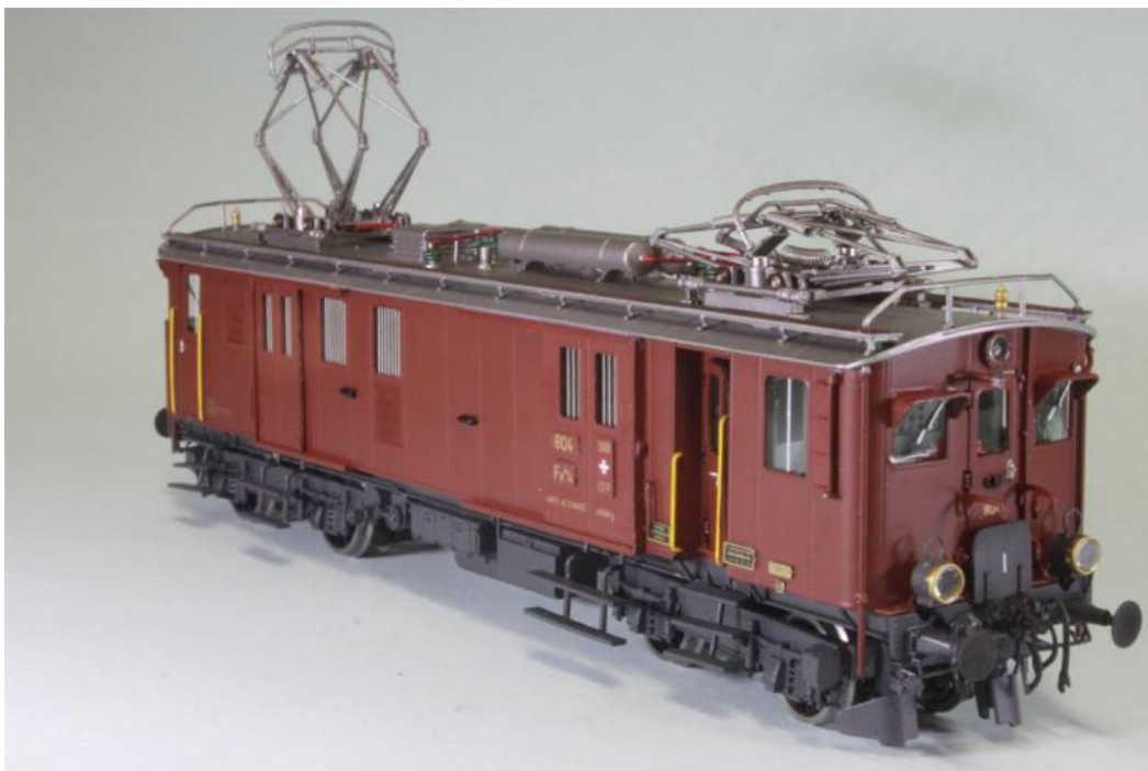
SBB/CFF Fe 4/4 no 804 "Seetaler", sehr frühe Version noch mit 2 Pantografen, noch Stangenpuffer, und Tafelbeschriftung, aber bereits mit linkseitigem Seitenfenster (auf unterem Foto ersichtlich) Jahrgang 1950, unsere Art.no.: 2268/4

Den Aufbau, Präzision und Laufeigenschaften (mittels 2 Motoren), plus das Gewicht von fast 400 Gramm ermöglicht eine sehr gute und starke Traktion. Sämtliche Türen, Frachttüren, etc. sind natürlich zu öffnen, echter Holzboden im Laderaum, etc. ergänzen die Perfektion. Die Modelle sind auch bereits mit einem Decoder versehen (ESU V5.0) und mit den entsprechenden Beleuchtungen ausgestattet (Frontbeleuchtung 3-0 oder dem Jahrgang entsprechend 3:1), Führerstandbeleuchtung und separater Frachtraumbeleuchtung. Stromaufnahme über alle Räder, Midestradius 2 (420mm). Ein rein analoges Modell ist auf Vorbestellung natürlich auch lieferbar. Die Produktion ist auf ein Total von 170 Triebwagen vorgesehen.