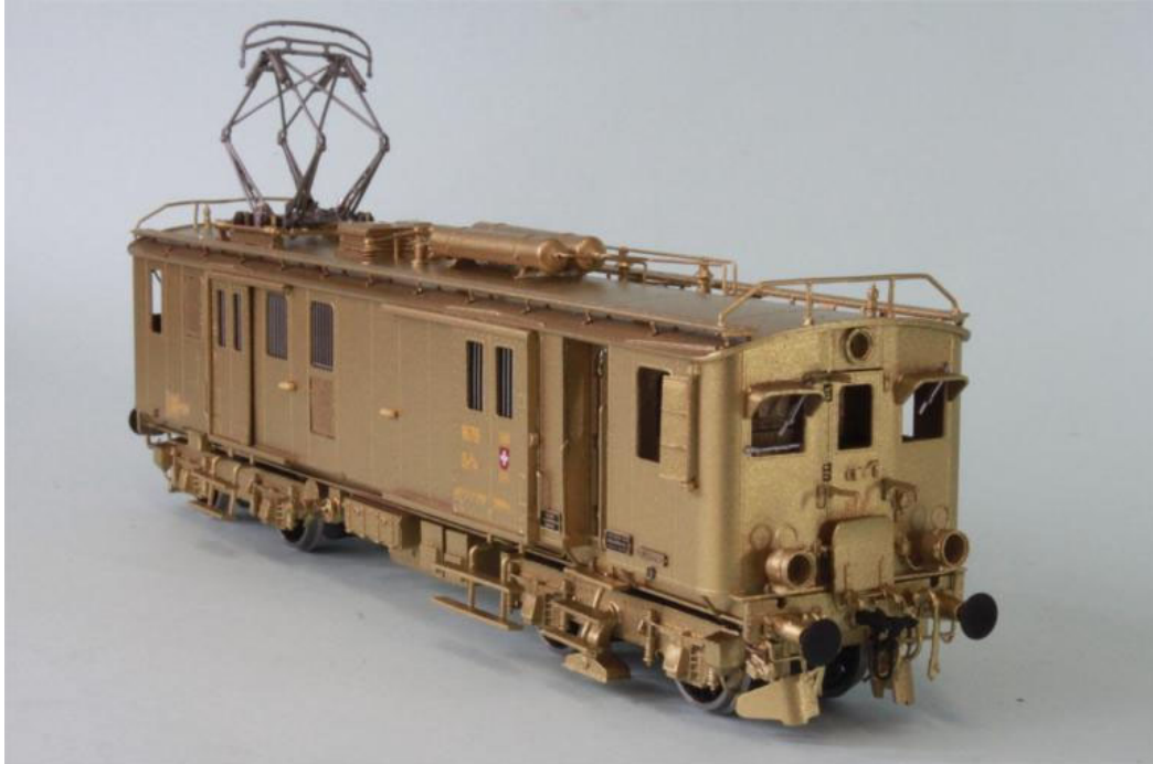
Das noch unlackierte Modell des SBB/CFF De 4/4 no 1679 "Rorschach" (SBB grün), dieser Triebwagen wurde bereits auf einen Pantografen umgebaut und besitzt die "Hülsenpuffer", Indusi-Zugsicherung, er wird auch die Laternen (ohne Messingring) haben. Es handelt sich dabei bereits um die historische Erhaltungsversion von 1963.

Das Besondere daran war, dass die kompletten Einheiten (inkl. Wagen) blau/weiß lackiert wurden, dies um der Zugsgarnitur einen etwas besseren "Status" zu gewähren. Diese Züge erhielten dann bald im Volksmund den Namen "Arbeiterpullmann". Diese Farbgebung verschwand aber bald wieder. Der Triebwagen De 4/4 no 1678 wurde übrigens nach seiner Ausserbetriebsetzung restauriert und wieder in seine ursprüngliche Farbgebung als "Arbeiterpullmann" no 18518 zurückversetzt und steht heute im Verkehrshaus der Schweiz in Luzern.