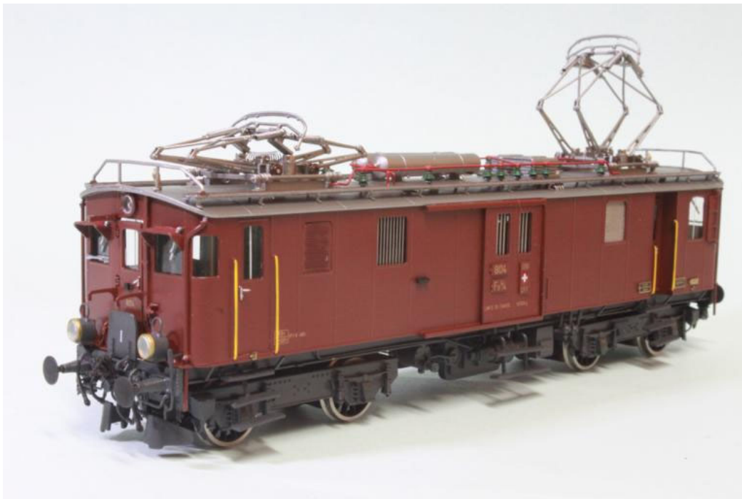
SBB/CFF no 804 "Seetaler", gut ersichtlich das nachträglich eingebaute Seitenfenster (nur linksseitig), gelbe Griffstangen und das Typische "Seetaler"-braun, übrigens; der Tachycounter Antrieb fehlt noch.

Auslieferung ist auf Frühling 2023 vorgesehen. Wir können Ihnen nun hier die ersten fertigen Prototypen präsentieren (eventuelle Modifikationen und Farbkorrekturen werden noch berücksichtigt) . Untenstehend sehen Sie die aktuellen Modelle in Produktion (zusätzlich wurde noch die Ref.no. 2268/6 in das Programm aufgenommen):