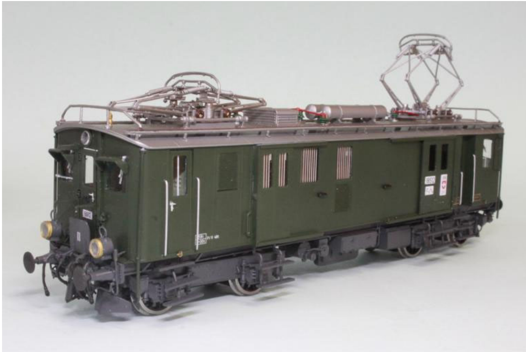
Seite Führerstand 2 des Ur-Prototypen, natürlich noch mit Stangenpuffer, Email-Tafeln an der Frachttüre, übrigens; der Tachycounter Antrieb fehlt noch an den Prototypen (unsere Art.no.: 2268)

Den Aufbau, Präzision und Laufeigenschaften (mittels 2 Motoren), plus das Gewicht von fast 400 Gramm ermöglicht eine sehr gute und starke Traktion. Sämtliche Türen, Frachttüren, etc. sind natürlich zu öffnen, echter Holzboden im Laderaum, etc. ergänzen die Perfektion. Die Modelle sind auch bereits mit einem Decoder versehen (ESU V5.0) und mit den entsprechenden Beleuchtungen ausgestattet (Frontbeleuchtung 3-0 oder dem Jahrgang entsprechend 3:1), Führerstandbeleuchtung und separater Frachtraumbeleuchtung. Stromaufnahme über alle Räder, Midestradius 2 (420mm). Ein rein analoges Modell ist auf Vorbestellung natürlich auch lieferbar. Die Produktion ist auf ein Total von 170 Triebwagen vorgesehen.