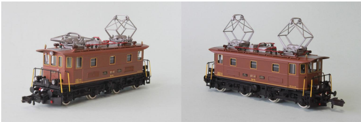
Art.no.: 1161/2 "Oswald-Stein Be 4/4 no 14, env. 1989