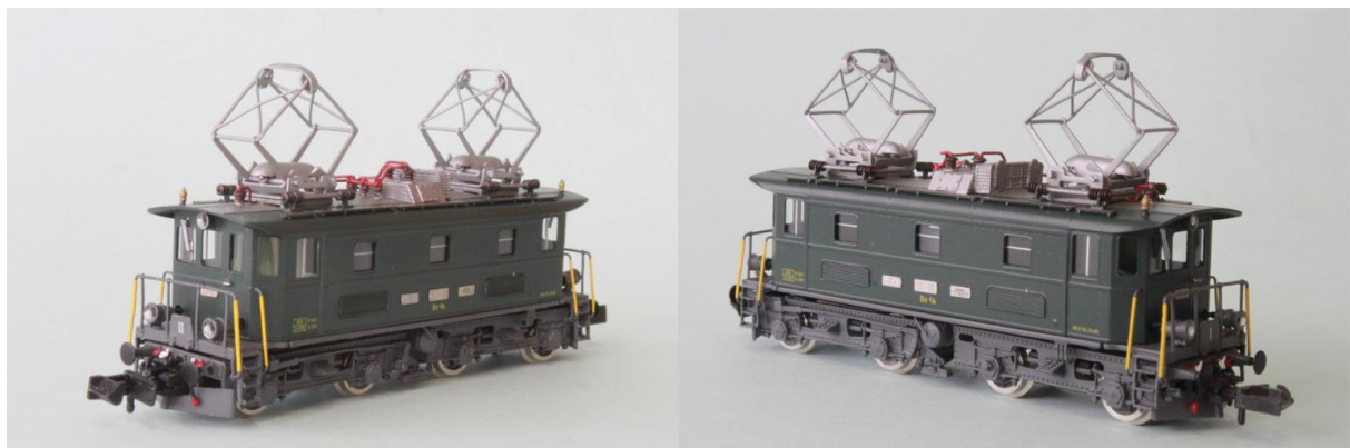
Art.no.: 1161/4 BT Be 4/4 no 16, env. 1965

Nous voulons absolument aussi une locomotive de la génération plus tard et "en service d'époque" des années 60. La machine no 16 restée en service jusqu'en 1988 chez la BT. En l'année 1991, les moteurs no. 3 et 4 fut démontée et la machine est devenue la Be 3/4 no 16. La machine était utilisée jusqu'en 1994 uniquement pour des manoeuvre dans la gare de Herisau. Cette machine est la seule loco de la série des Be 4/4 qui fut démontée en 1997. Notre modèle est la machine du service d'époque de la BT en env. 1965. Date de révision (REV): 22.10.1965