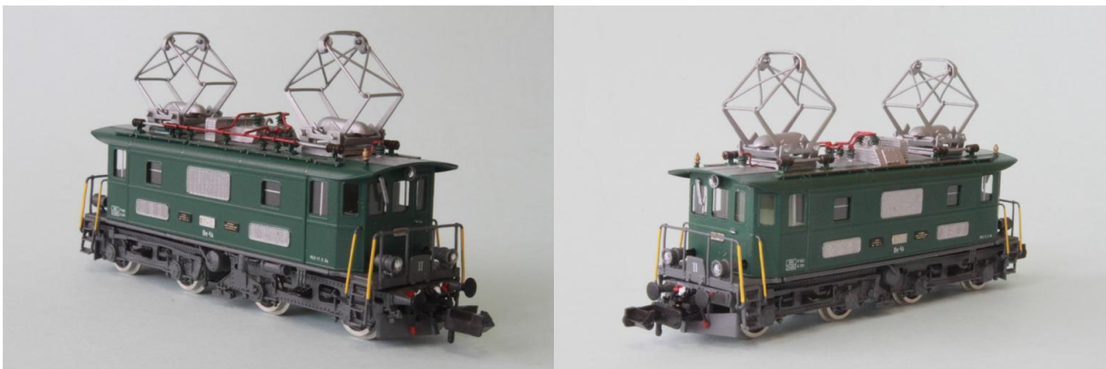
Art.no.: 1161/1 BT Be 4/4 no 11, env. 1994

Notre modèle est la loco "historique" en couleur "vert pale" de l'année 1994. Date de révision (REV): 17.3.1994