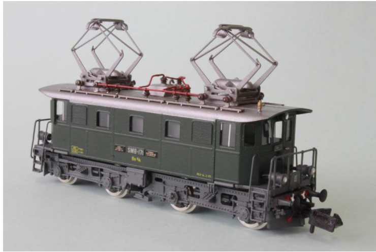
Art.no.: 1162 SMB Be 4/4 no 171

Les différences entre les BT, EBT et SM sont surtout les grilles d'aération, les dispositions sur le toit, les pantos et aussi les plateformes avec les calandres, etc.....(veuillez voir aussi notre histoire de chaque machine en production).