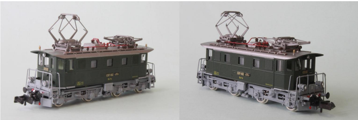
Art.no.: 1162/1 EBT Be 4/4 no 102, "Historic", ca. 1997

Die Lok no 102 wurde ab 1997 zum historischen Triebfahrzeug erklärt. Die Maschine bekam wieder ein hellgrauges Chassis und ein silbernes Dach. Nach der Fusion der BLS Lötschberg-Bahn kam sie 2006 in den Bestand der BLS, welche sie dann in die BLS Stiftung überführte. Dort wird sie als historisches Erbe der BLS gepflegt. Die Maschine ist noch voll betriebsfähig und wird für Sonderfahrten eingesetzt. Unser Modell ist die historische Version mit dem hellgrau Chassis. REV-Datum: R3 14.6.1997