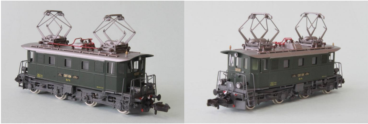
Art.no.: 1162 EBT Be 4/4 no 104, ca. 1963

EBT Be 4/4 Lok no. 102; unsere Art.no.: 1162/1