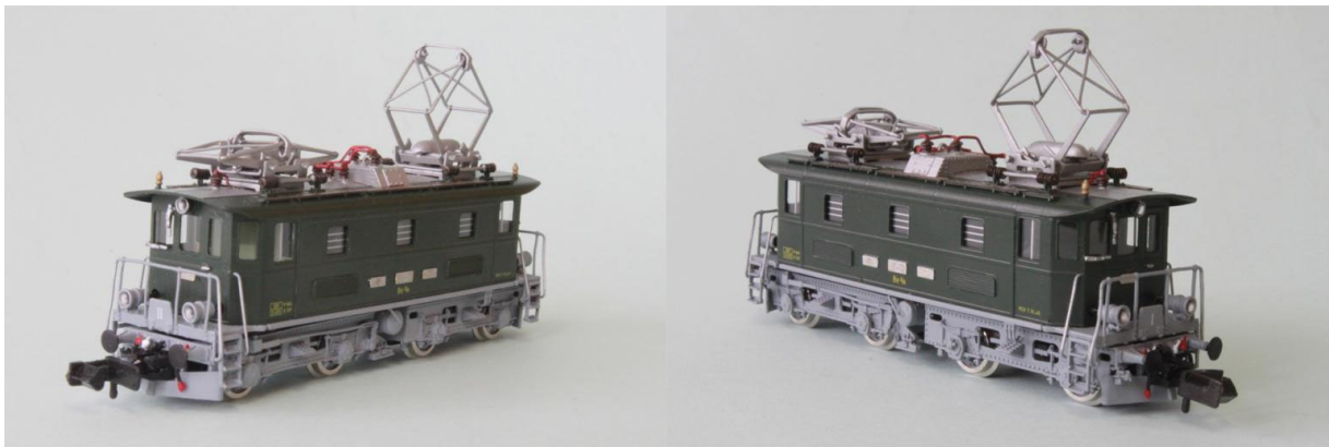
Art.no.: 1161 BT Be 4/4 no 12, ca. 1931 - 1946

Diese Lok war von 1931-1997 im Betrieb bei der BT. Die Maschine wurde dann 1998 remisiert und als Ersatzteilsender (vorallem für die Lok no 11) bestimmt. Im Herbst 2002 wurde die Lok dann allerdings an eine Privatperson verkauft und wartet seitdem auf eine betriebsfähige Aufarbeitung. Unser Modell wird die frühe Betriebs-Ausführung (mit hellgrauem Chassis) in den Jahren 1931-1948 erhalten. REV-Datum: 7.10.1946