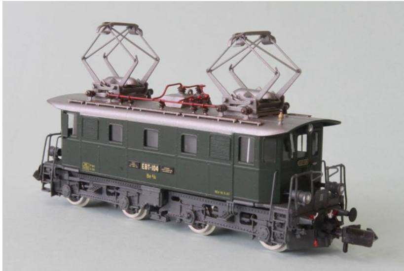
EBT Be 4/4 no 104

Die Unterschiede der einzelnen Typen sind sehr frappant; Lüftergitter, Dachaufbauten, Stirnseiten mit Handläufen, verschiedene Pantos, etc....(Siehe Bilder der Loks, bitte beachten Sie auch die untenstehende historische Geschichte jeder einzelnen Lok).