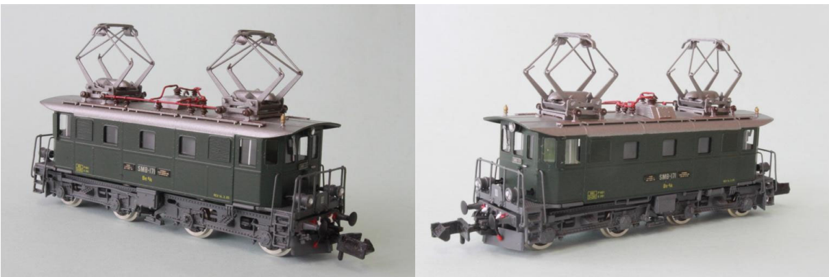
Art.no.: 1163 SMB Be 4/4 no 171, ca. 1966

Die Maschine Be 4/4 no 171 war eine von zwei Loks die von der EBT an die SM abgetreten wurde. Ursprünglich waren dies die no 107 - 108. Ab der Ummummerierung von 1963 wurde aus der no 107 die no 171 (108 zu no 172). Die Lok no 171 war bis um 1997 im regulären Dienst, wurde aber ab 1999 ebenfalls zur historischen Lok und erhielt eine Hauptrevision R3. Die Association SWISSTRAIN konnte die Lok 2006 käuflich erwerben. Sie wird aktuell mietweise vom Verein Dampfbahn Bern für Extrazüge eingesetzt. Unser Modell ist die reguläre Dienstmaschine der SM (Solothurn-Münsterbahn) von ca. 1966. REV-Datum: 14.3.1965