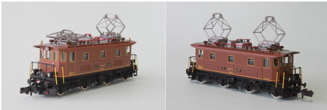
Art.no.: 1161/2 "Oswald-Steam" Be 4/4 no 14, ca. 1989

Ursprünglich war diese Maschine bis 1988 bei der BT im regulären Dienst eingesetzt. Uebernommen wurde dann diese Lok von der "Reisegruppen-Vereinigung OSWALD-STEAM" in Samstagern. Dort wurde die Lok radikal umlackiert und neu aufgebaut. Anstelle des grünen Farbleides erhielt die Lok eine braune Farbe mit gelben Zierlinien und Filets. Geplant war eine komplette Komposition mit GB-Wagen zu erstellen, wurde dann aber durch die Aufgabe der Firma nie verwirklicht. Die Lok kam dann in den Bestand der damaligen Südostbahn, welche sie für Nostalgiefahrten einsetzte. Nach der Fusion zur SOB (mit der BT), wurde die Lok dann im 2006 an die EUROVAPOR in Sulgen verkauft. Die Lok ist noch heute an verschiedenen Sonderfahrten im Einsatz und besticht durch die aussergewöhnliche braune Farbe. Unser Modell ist die Version von "OSWALD-STEAM" in brauner Farbgebung von 1989. REV Datum: 10.8.1988