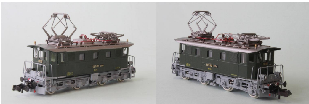
Art.no.: 1162/1 EBT Be 4/4 no 102, "Historic", ca. 1997

Die Lok no 102 wurde ab 1997 zum historischen Triebfahrzeug erklärt. Die Maschine bekam wieder ein hellgraues Chassis und ein silbernes Dach. Nach der Fusion der BLS Löttschberg-Bahn kam sie 2006 in den Bestand der BLS, welche sie dann in die BLS Stiftung überführte. Dort wird sie als historisches Erbe der BLS gepflegt. Die Maschine ist noch voll betriebsfähig und wird für Sonderfahrten eingesetzt. Unser Modell ist die historische Version mit dem hellgrauem Chassis. REV-Datum: R3 14.6.1997