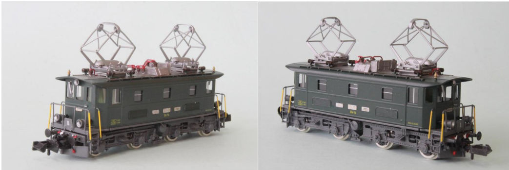
Art.no.: 1161/4 BT Be 4/4 no 16, ca. 1965

Wir wollten unbedingt auch eine Lok der späteren Generation des regulären Dienstes bei der BT. Diese Lok verblieb bis 1988 im Dienste der BT. Im Jahre 1991 wurde die Lok ihrer Fahmotoren no 3 und 4 beraubt und somit zur Be 3/4 no 16 degradiert. Die Lok wurde ab da zum Rangierdienst in Herisau eingesetzt. Ab 1994 wurde die Lok dann als ausrangiert gemeldet, blieb aber offenbar noch irgendwo hinterstellt. Im März 1997 wurde sie dann, als bis jetzt einzige Lok dieser Serie, abgebrochen. Unser Modell ist die reguläre Dienstmaschine der BT von ca. 1965. REV-Datum: 22.10.1965