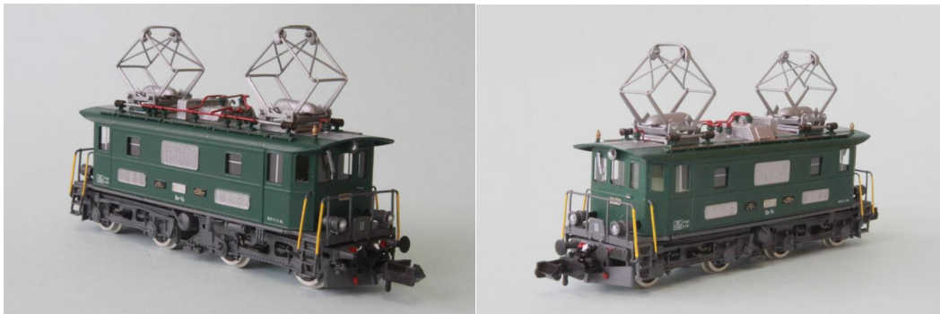
Art.no.: 1161/1 BT Be 4/4 no 11, "Historic", ca. 1994

Es war dies ursprünglich der Prototyp aller Be 4/4 Loks. Die Be 4/4 no 11 befindet sich noch immer im Bestand der BT, wird aber nur noch als Reservelok und zu Sonderfahrten eingesetzt. Nach der Fusion von BT und SOB zu der neuen SOB blieb sie als "historisches Fahrzeug" erhalten und erhielt (buchmässig) die neue UIC-Nummer BE 416 011-5. Die Lok trägt aber immer noch Ihre alten Bronzeschilder mit der Aufschrift "BT-11". Unser Modell ist die "historische Lok" in "Moosgrüner" Farbe und in der Ausführung von ca. 1994. REV-Datum: 17.3.1994