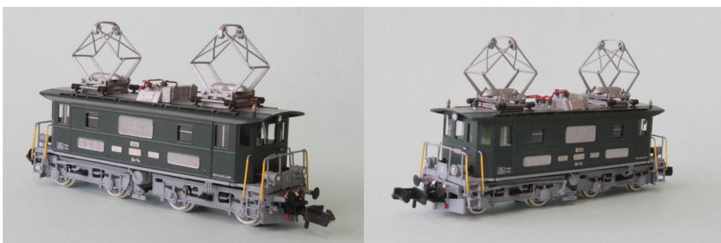
Art.no.: 1161/3 "DVZO" Be 4/4 no 15, ca. 2002

Diese Lok wurde in 1988 von der Dampfbahn-Vereinigung Zürcher-Oberland, kurz DVZO von der BT erworben. Die Maschine befindet sich noch im regulären Dienst-Originalzustand (ausser dem nachbemalten hellgrauem Chassis der älteren Epoche).