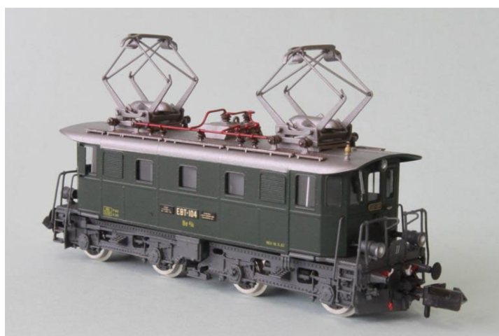
EBT Be 4/4 no 104

Die Produktion unserer Serie der Elektrolok Be 4/4 in Spur N Modelle ist vollendet und wir können Ihnen hier bereits die ersten fertigen Modelle vorstellen. Es ist bis jetzt eine der kleinsten E-Loks die wir in Spur N herstellen haben; wirklich reine "Uhrmacherarbeit".