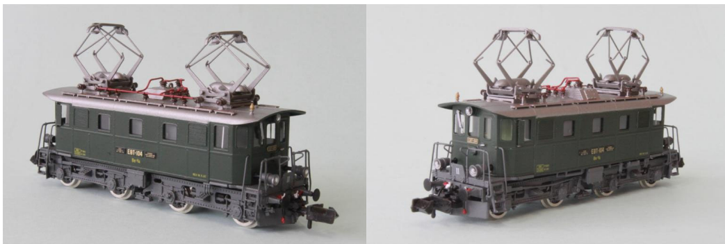
Art.no.: 1162 EBT Be 4/4 no 104, ca. 1963

Diese Maschine versah ihren regulären Dienst bei der EBT bis im September 2000. Darauf wurde die Lok ausrangiert und remisiert. Im gleichen Jahr wurde die Lok aber doch noch an die Vereinigung CLASSIC RAIL verkauft. Zuletzt abgestellt wurde die Maschine in Le Locle. Die Lok ist bis heute nicht betriebsfähig. Unser Modell ist die Maschine im regulären Dienste bei der EBT von ca. 1963. REV-Datum: 18.5.1962