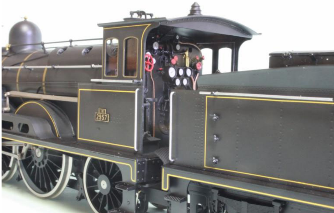
ETAT 221-2957 "Atlantic, avec le tender à 3 essieux d'origine NORD, (notre Art.no.: 2659/6), cette machine est de couleur GRIS-OURAL avec des filets jaune