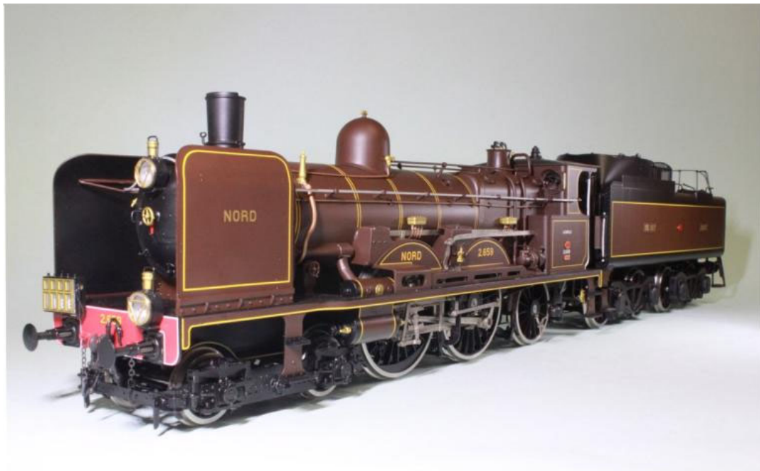
L'Oiseau-Bleu (Amsterdam-Bruxelles-Paris), L'Atlantic no 2.659 avec paré-fumées et grand tender (notre Art.no.: 2659/3)

D'autres pays que la France en firent l'essai: le Great Western anglais avec deux exemplaires qui restèrent en service courant après quelques transformations et plaidèrent pour la pratique du compoundage dans ce pays, ou le réseau américain du Pennsylvania qui fit un essai avec une locomotive. Toutefois, ces essais ne furent pas suivis d'une descendance, la locomotive française ayant trop de différences techniques par rapport aux machines classiques de ces pays.