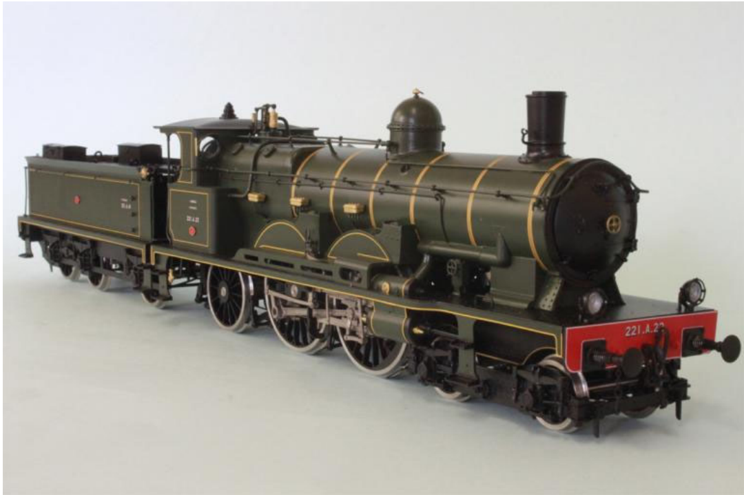
SNCF 221 A 22 "ATLANTIC", (notre Art.no. 2659/7)