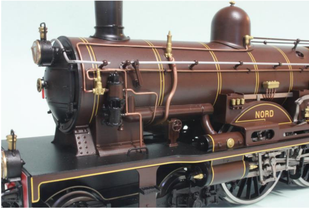
Details Atlantic NORD

Tout d'abord, situons le problème en nous référant à l'automobile, bien connue de tous. Une voiture de course va vite non seulement parce qu'elle a un moteur plus puissant, mais aussi et surtout, parce que ce moteur tourne beaucoup plus vite que celui d'une voiture ordinaire. En outre, le couple moteur d'automobile est plus grand à haut régime qu'à bas régime, ce qui veut dire que le moteur "arrache" plus à haute vitesse qu'au démarrage, ou si l'on veut "répond" mieux. Comme toute machine à vapeur, le moteur d'une locomotive à vapeur ne peut donner qu'un certain nombre de coups à la minute, environ une centaine. Il n'est pas possible, à l'instar des automobiles p.ex., d'augmenter la vitesse en augmentant la puissance et le régime du moteur. Avec un moteur à vapeur, la puissance ne provient que de la chaudière (elle est donc constante et indépendante du régime du moteur), sachant que l'effort de traction (ou le couple moteur) diminue avec la vitesse; une locomotive est très puissante au démarrage et "arrache" facilement son train, mais, au fur et à mesure que la vitesse augmente, l'effort de traction disponible au crochet d'attelage décroît. Pour que la locomotive à vapeur puisse donc rouler de plus en plus vite, la seule solution est d'augmenter le diamètre des roues motrices, exactement comme on a fait pour les "ATLANTIC".