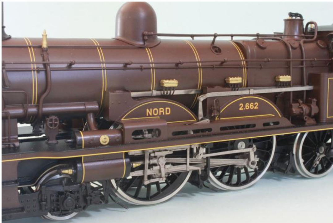
vue détails del la NORD no 2.662 (encore des petites corrections peintures et visserie)

La fabrication des ATLANTIC's 221 est faites; des modèles en écartement "0" (1:43,5); une machine déjà annoncée depuis quelques temps dans nos catalogues - une machine qui manque en modèle réduit en écartement 0. Les modèles sont exécutés, comme d'habitude chez FULGUREX avec un soin et une qualité extraordinaire comme p.ex. aménagement de la cabine, portes ouvrantes, éclairage fonctionnement en digital DCC, sonorisation (décodeur ESU), moteur de précision (dans la machine), etc, etc.... Nous avons choisi des div. machines, div d'époques et compagnie comme suiv. ATTENTION; des nouveaux No.d'article que dans notre catalogue: