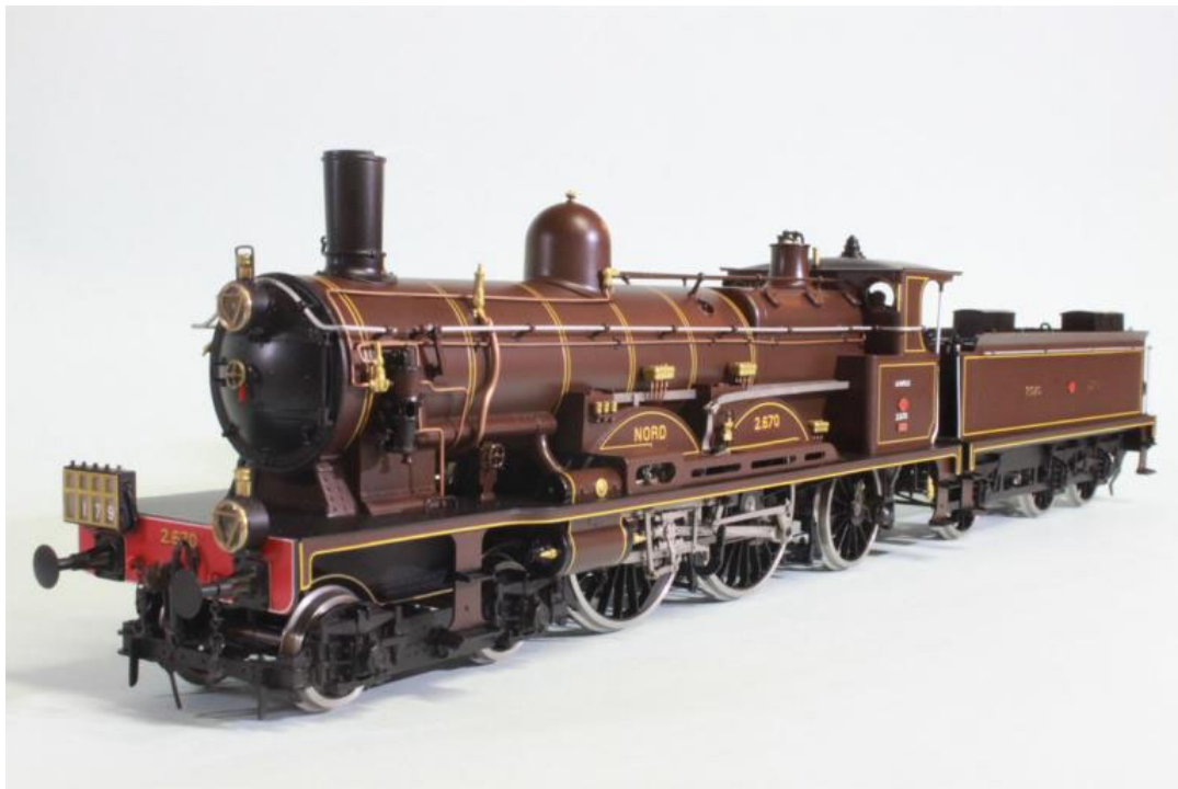
L'Atlantic NORO 221 no 2.670, machine du Musée de Mulhouse (notre Art.no. 2659)

Cette machine, construite dans les Ateliers de Belfort de la société Alsacienne, la machine est dotée de tous les perfectionnements en vigueur à l'époque: foyer Belpaire, soupapes Adams, injecteurs Friedmann, tubes Serve dans le faisceau tubulaire de la chaudière, séparation des marches haute et basse pression au démarrage, échappement à cône mobile entre autres caractéristiques dernier cri dont la thermodynamique et la science des chemins de fer sont capables en ce tout début du siècle.