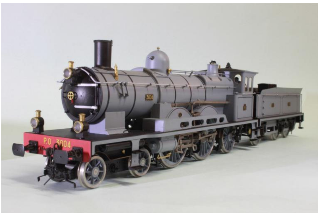
Atlantic PO 221-3004; env. 1910 (notre Art.no.: 2659/4) cette machine est de