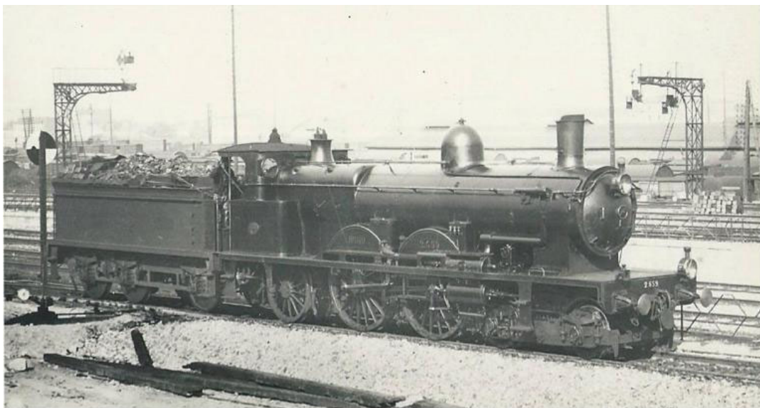
Atlantic NORD 221 no 2.659 dans son état d'origine (env. 1903), notre Art.no.: 2659

La série des modèles ATLANTIC 221 en écartement 0 (1:43,5) de FULGUREX est naturellement très limitée. Nous proposons à des amateurs du "0" une série d'un total de seulement 55 machines (dans les div. versions).