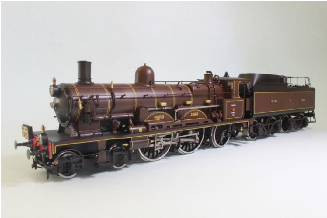
Art.no.: 2659/1 NORD 221 Atlantic no 2.662, avec tender 37m/cub pour le train no 185

La 221 Atlantic est née en 1900 pour la compagnie du NORD sous le signe des "3"; veut dire, que cette locomotive devait en effet couvrir en 3 heures (soit à une moyenne de 100 km/h la distance de 300 km en tête d'un train de 300 tonnes). Cette machine préfigure parfaitement "la locomotive de vitesse moderne", même si, aux yeux d'un passionné français, elle semble bien faible et légère avec ses deux essieux moteurs seulement - mais c'est sans doute une machine très élégante !