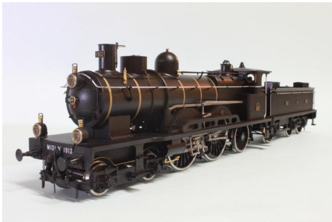
Midi 221-1912 "Atlantic" (avec 3ème dome supplément; notre machine a deux domes) avec tender 3 essieux d'origine NORD (notre Art.no.: 2659/5), cette machine est de couleur NOIR avec des cercles de boiler en LAITON et cabine ouverte

En 1938 l'ensemble de ces machines sont toujours en service dans les grandes dépôts du NORD. Elles sont souvent munies de grands tender à bogies de 37m 3 vu l'allongement de leur parcours. Quelques machines sont mis en services par la SNCF.....Le Musée français du Chemin de fer à Mulhouse possède un exemplaire de cette série; la 2.670, qui est magnifiquement restaurée et qui rappelle une des plus belles période de la traction vapeur en France !