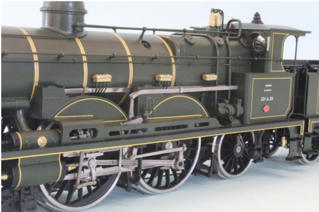
Détails de la machine no 221 A 22